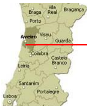
Distrito de Aveiro