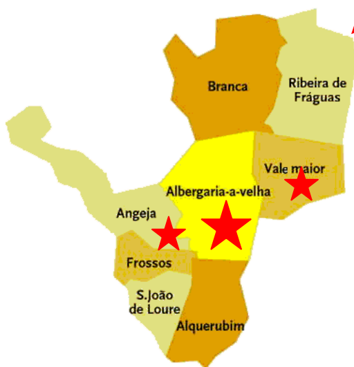
Freguesias do Concelho 1

★ - Freguesias da área de influência do Agrupamento